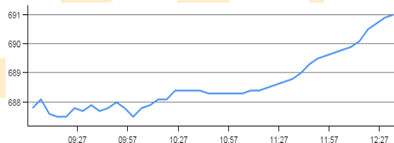
روند روزانه شاخص فرابورس: